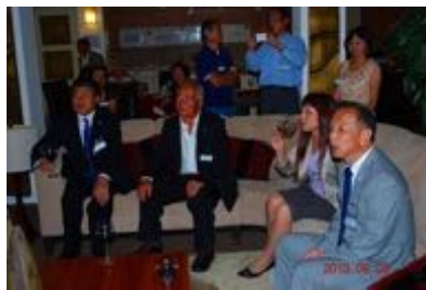
谷副会長のライブにかぶりつき??