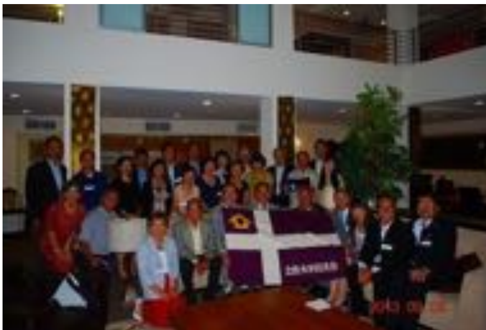
最後に参加者全員で記念撮影。次回の総長訪問はいつでしょうか？我々が会員のときにお見えになっていただき、幸運でした。