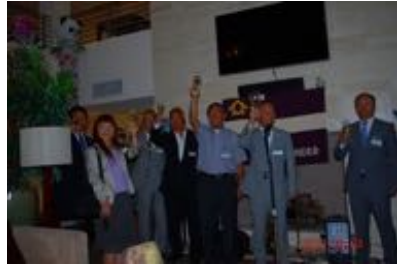
高らかにカンパニー!