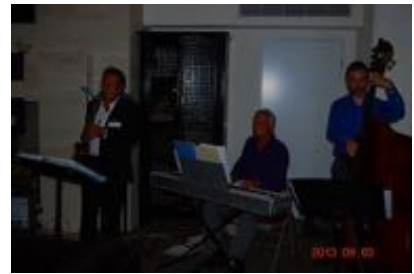
谷副会長と彼のグループによるライブミュージック