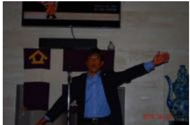
出相さんの先導でフレーフレー立教。お疲れ様でした。