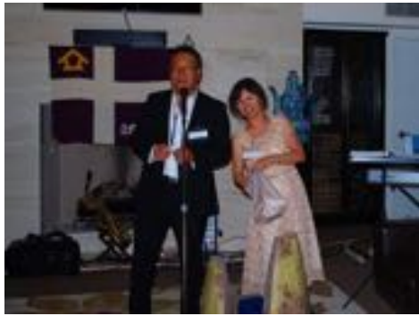
← 立教大学校友会からのお土産をくじ引き。大いに盛り上がりました。