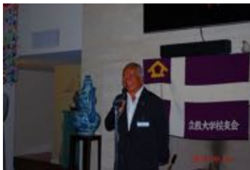
田尾校友会会長よりご挨拶と校友会の現状報告がありました