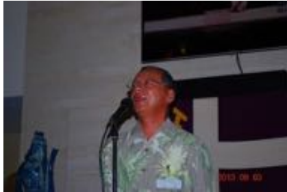
武井前会長より閉会の辞